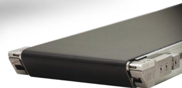
Knife edge i ECA 40 serien