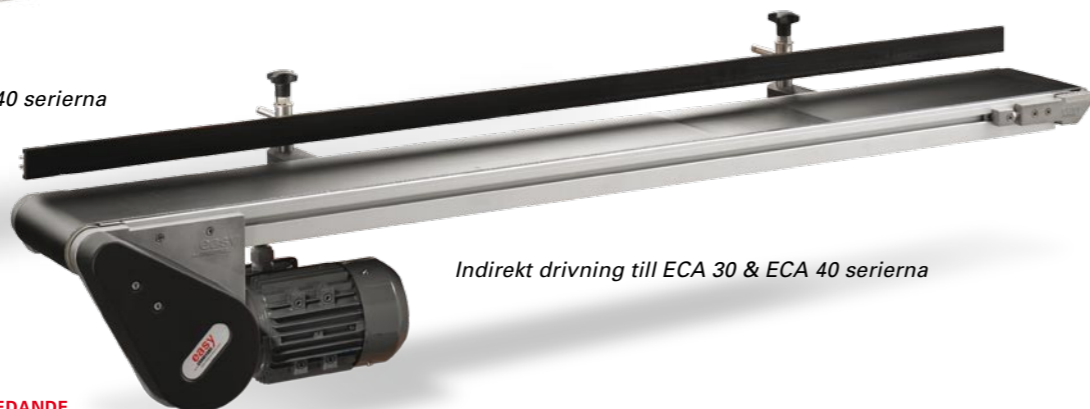
Indirekt drivning till ECA 30 & ECA 40 serierna