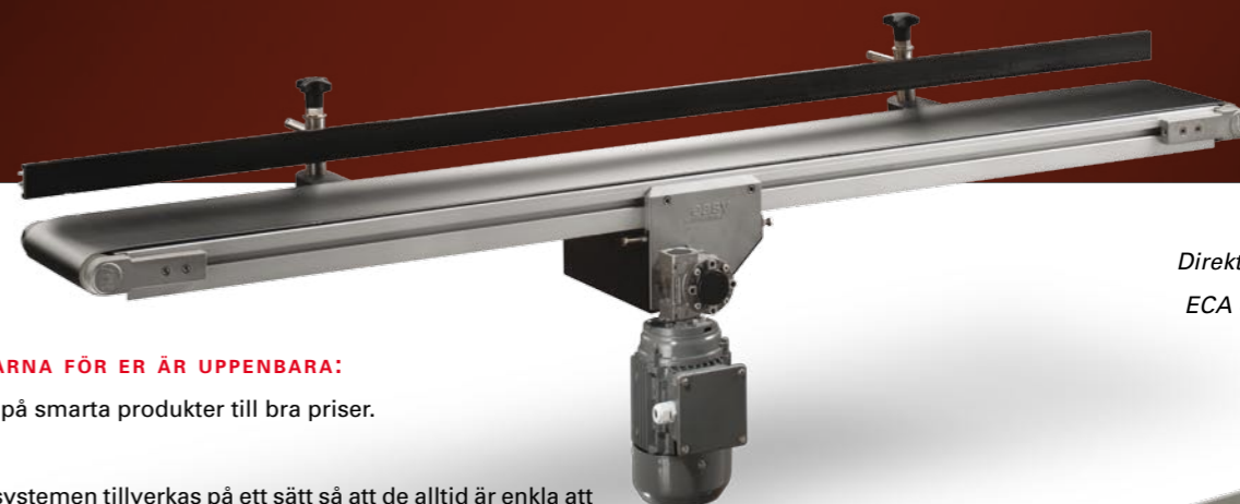
Direkt mittdrift ECA 40 serien