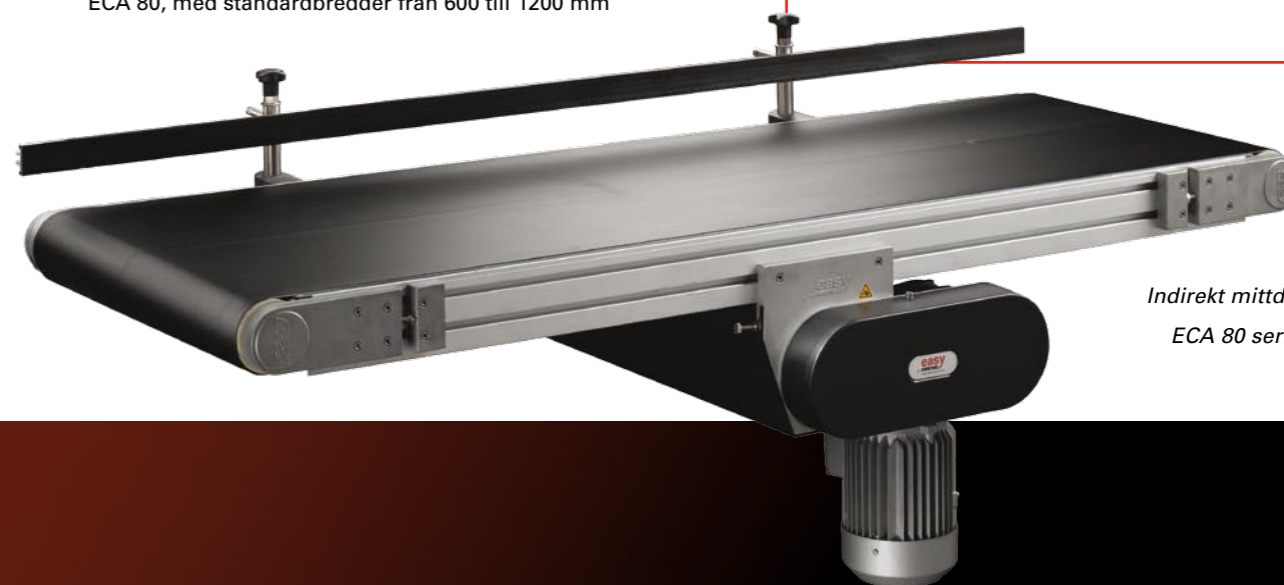
Indirekt mittdrift ECA 80 serien