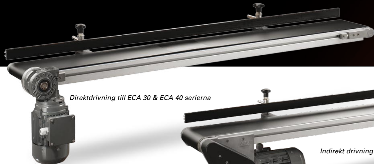
Direktdrivning till ECA 30 & ECA 40 serierna